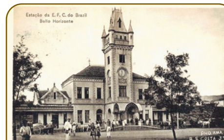
Antigo cartão postal mostra como era o primeiro prédio da Estação Ferroviária de BH

► História: o prédio abriga atualmente o Museu de Artes e Ofícios, com coleções e histórias de dezenas de atividades profissionais que deram origem a indústria de transformação em Minas Gerais.