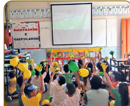
Alunos em sala de aula na Escola Municipal Moysés Kalil