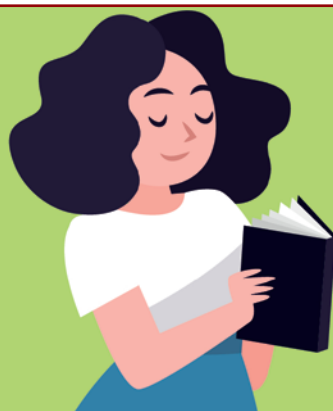
Imagem exclusiva mostra como é a agenda de quem se associa à AssempBH: