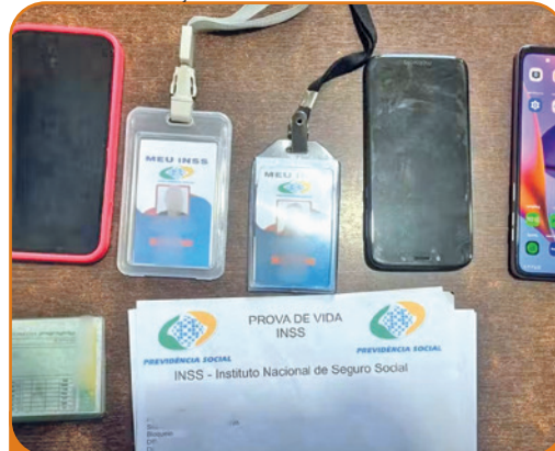
Crachás falsos utilizados por dois golpistas presos pela Polícia Militar de São Paulo