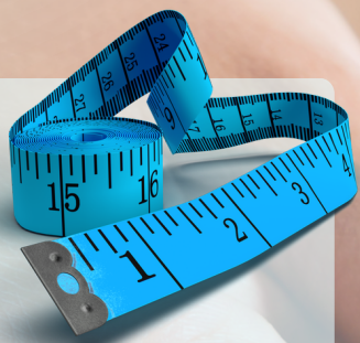
Medidas de circunferência